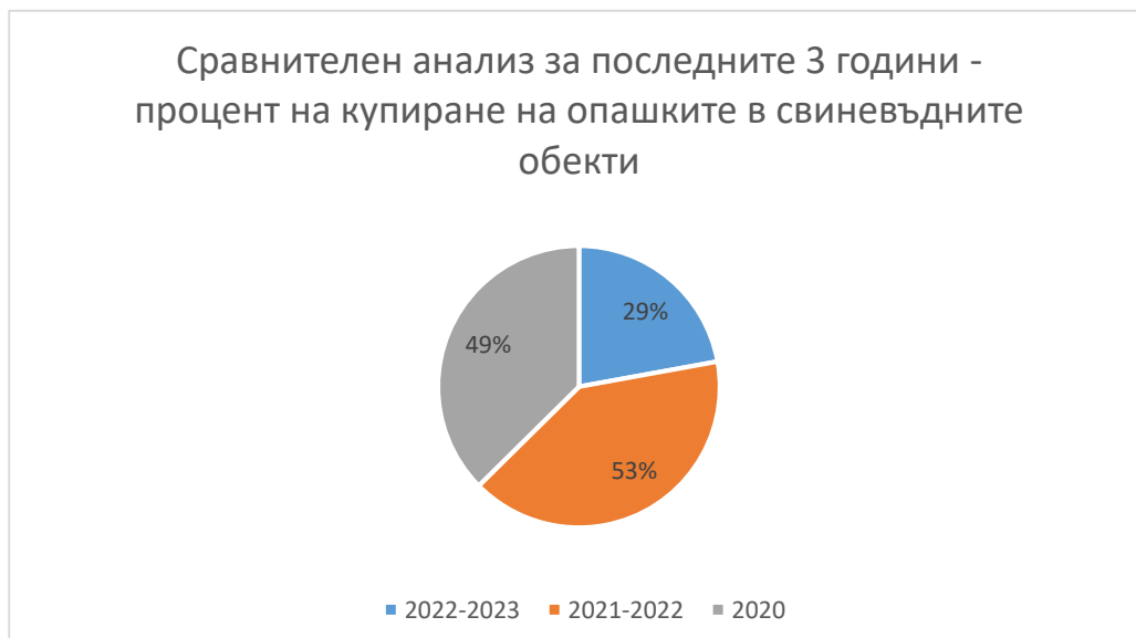
Фиг. 2: Купиране на опашки на прасета в свиневъдните обекти - 2020 г.; 2021-2022г. и 2022- август 2023 г.