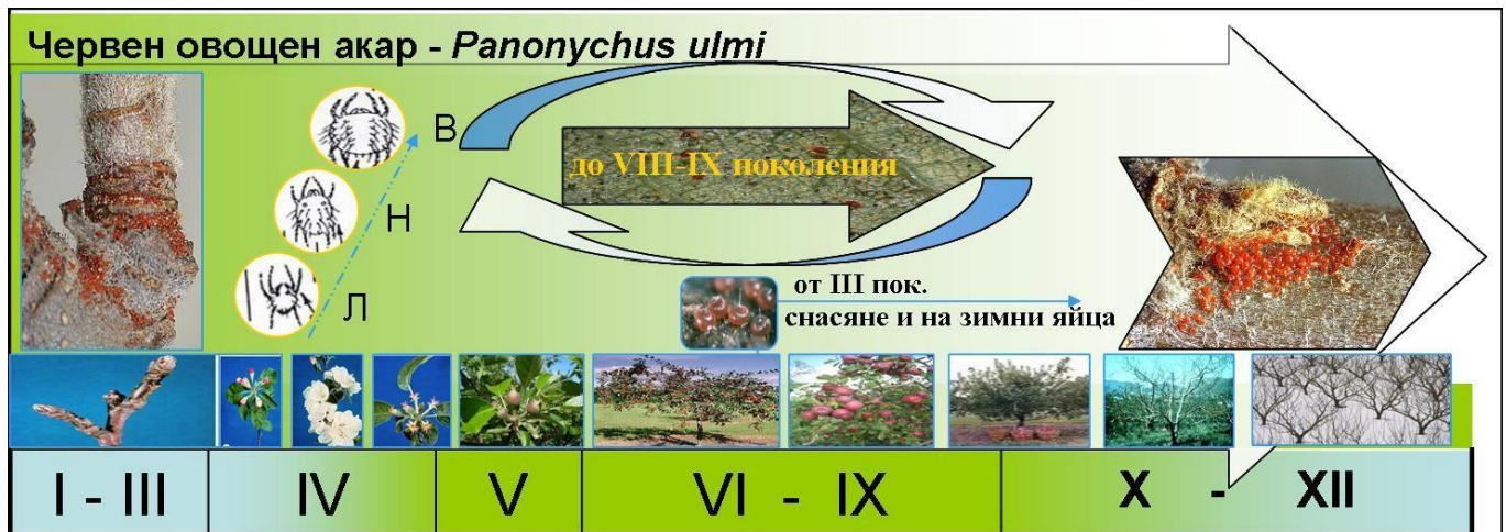
Фигура 8. Цикъл на развитие на червеният овощен акар Panonychus ulmi

Повреда: Червеният овощен акар не поврежда директно плодовете, но подтиска асимилационната дейност. Вреди като изсмуква клетъчен сок заедно с хлорофилни зърна. Намаляването на хлорофила в листата довежда до намаляване на фотосинтезата, вследствие на многобройните убождания по листата, транспирацията се увеличава и се появяват смущения във водния баланс на нападнатите дървета. Особено силни са повредите в сухи години, когато кореновата система поема от почвата по-малко вода, отколкото листата изпаряват. Всичко това довежда до намаляване размера и качеството на плодовете, до изхранване и залагане на по-малък брой плодни пъпки, до намаляване на сухо и зимоустойчивостта на дърветата и ги прави податливи на нападение от болести и неприятели.