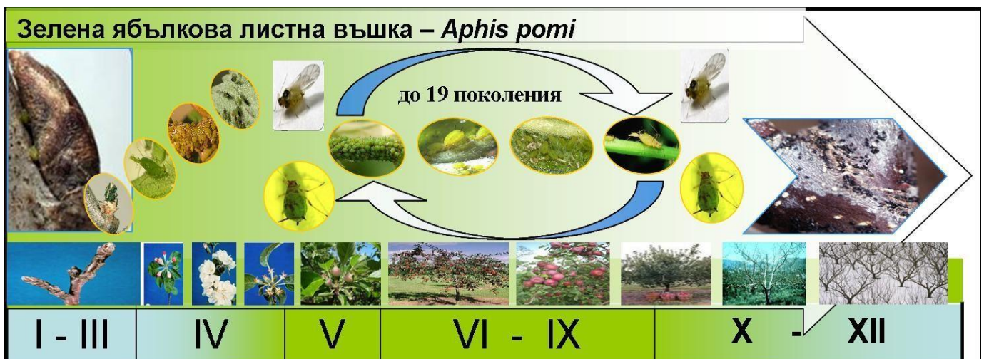
Фигура 5. Цикъл на развитие на зелената ябълкова листна въшка Aphis pomi

годишно. Зимува като яйце по леторастите, най-често в основата на пъпките. През март-април се излюпват ларвите, които смучат сок от младите листа. Излюпването съвпада с разпукването на пъпките. По време на цъфтежа се появяват възрастните основателки, които раждат 40-50 ларви. Образуват се колонии, които смучат сок от листата и връхните части на леторастите. Крилатите форми се появяват от второто поколение и разселват вида в овощната градина. През октомври се появяват половите форми. Те копулират и снасят от 1 до 5 яйца, които презимуват. Яйцата обикновено са на групи.