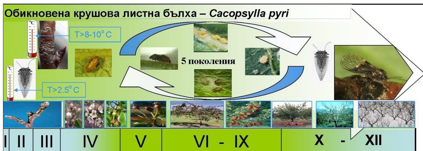
Фигура 7. Цикъл на развитие на обикновената крушова листна бълха Cacopsylla pyri