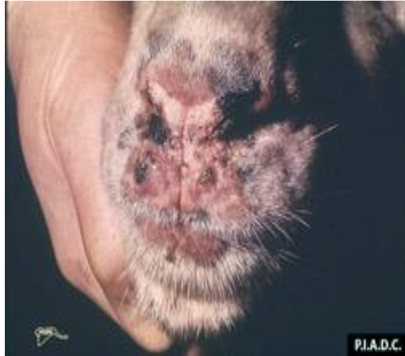
Снимка 6. Папули по носа и устата на овца