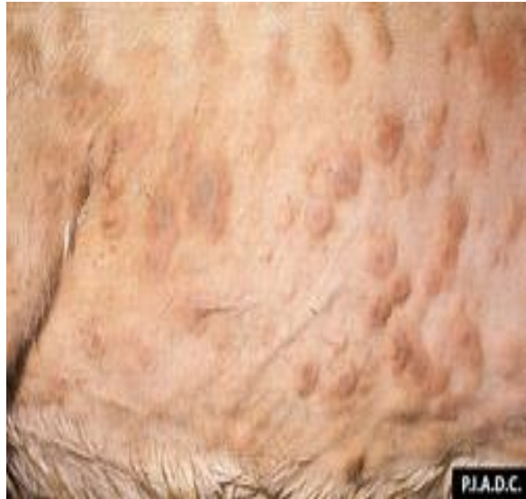
Снимка 2. Генерализирани папули при коза с некротичен център