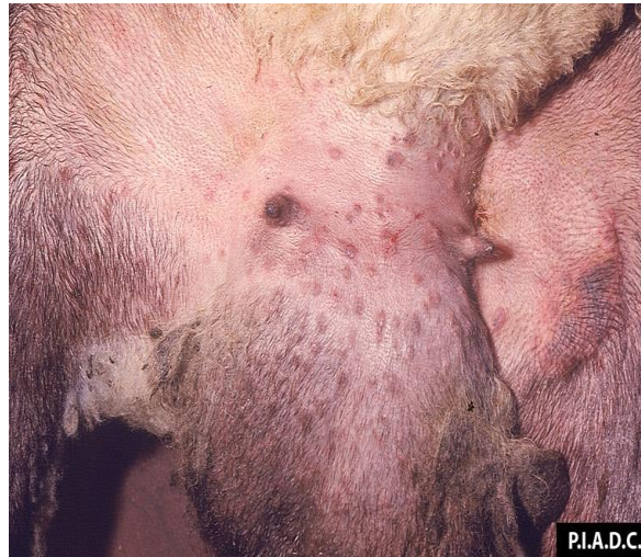
Снимки 3 и 4. Папули по ингвиналната кожа и скротума при овца