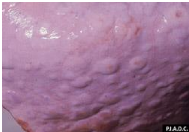
Снимка 8. Папули в белия дроб матката