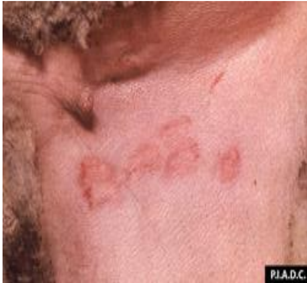
Снимка 1. Папули по ингвиналната област