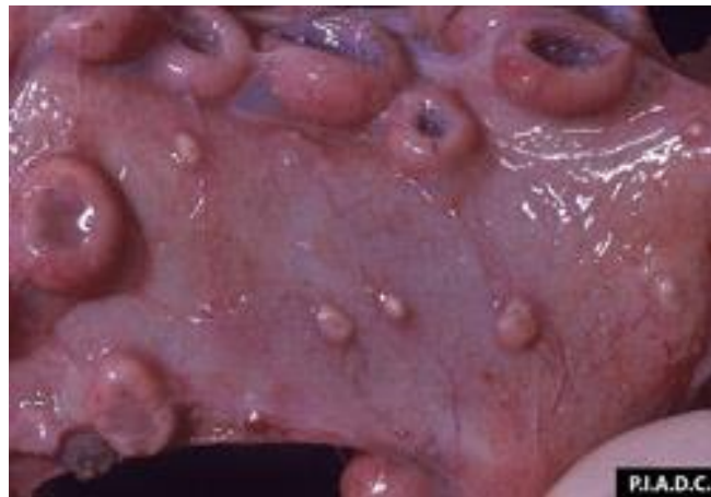
Снимка 9. Папули по лигавицата на