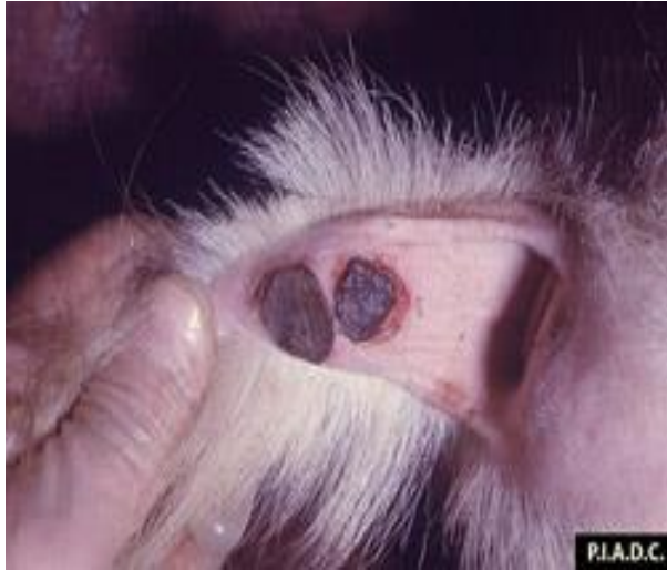
Снимка 5. Единични папули с некроза по опашката на коза